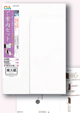
三つ折りガイド板付