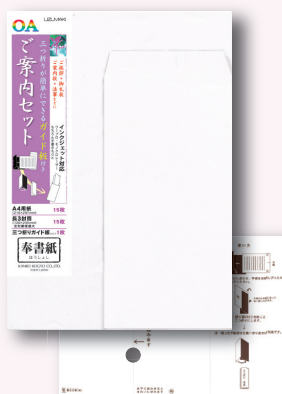
三つ折りガイド板付