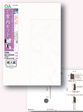
三つ折りガイド板付