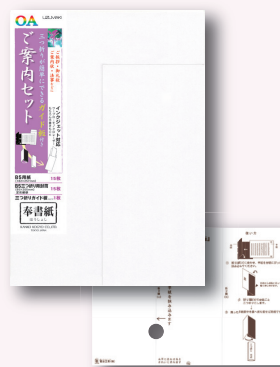
三つ折りガイド板付