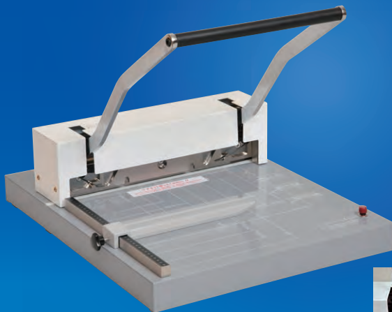
赤色LEDカットランプ